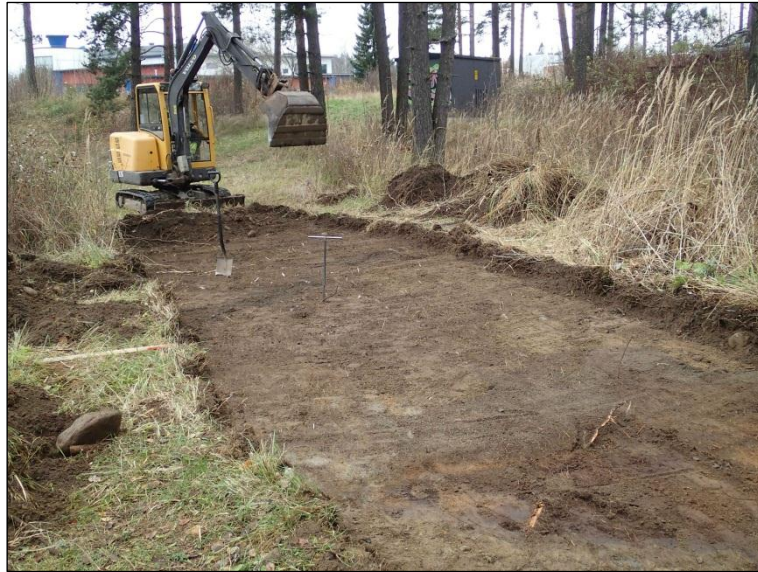
Puistokäytävän keskiosaa kaivettuna määräsyytyteen