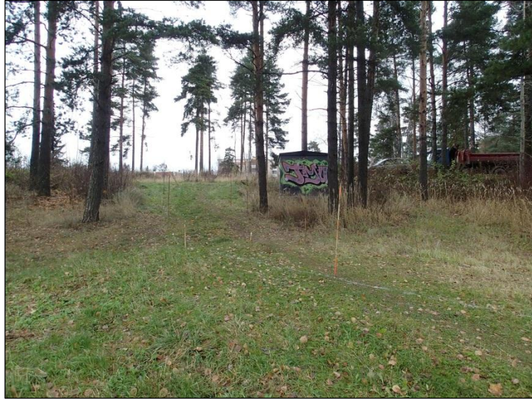
Maastoon merkittyä puistokäytävän linjaa ennen kaivamista