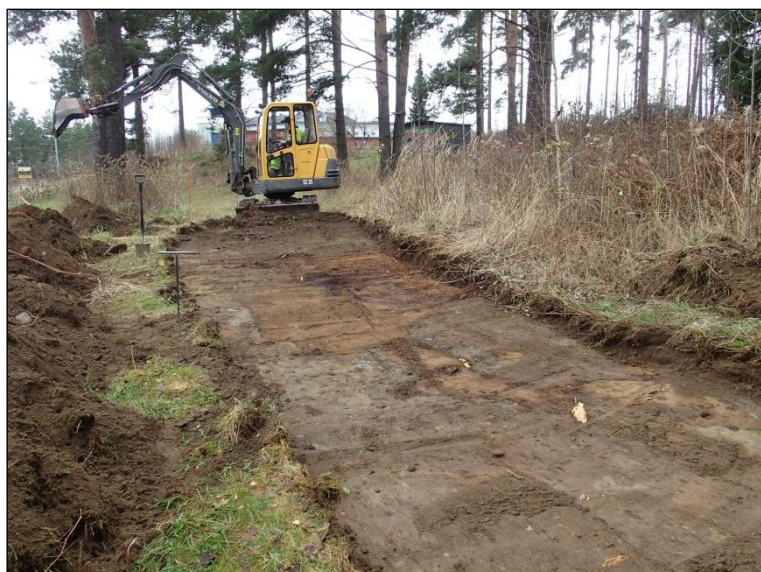
Puistokäytävän kaakkoisosaa kaivettuna määräsyyvyyteen.