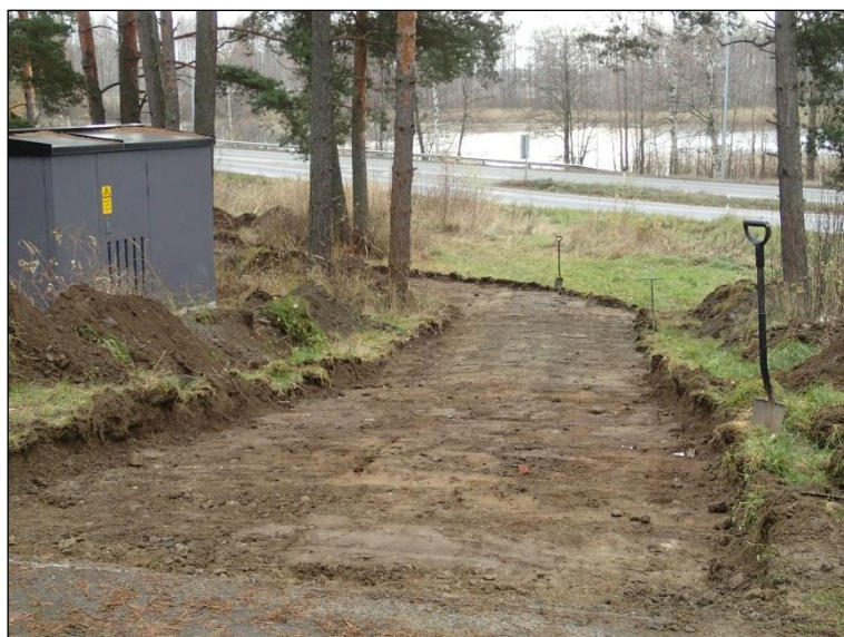
Puistokäytävän luoteisosaa kaivettuna määräsyytyteen