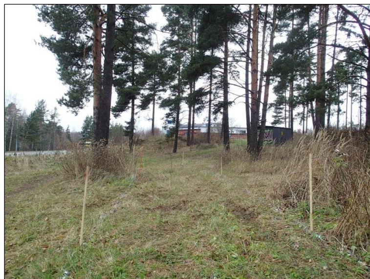
Maastoon merkittyä puistokäytävän linjaa ennen kaivamista